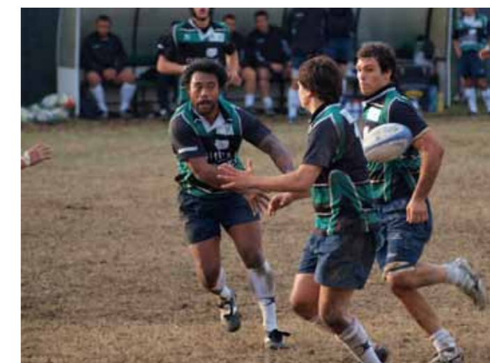
L'apertura Silao Leaga in azione a Formigine

PROTECNO PRODOTTI TECNOLOGICI EDILI E BIOEDILI SIGILLANTE PROFESSIONALE