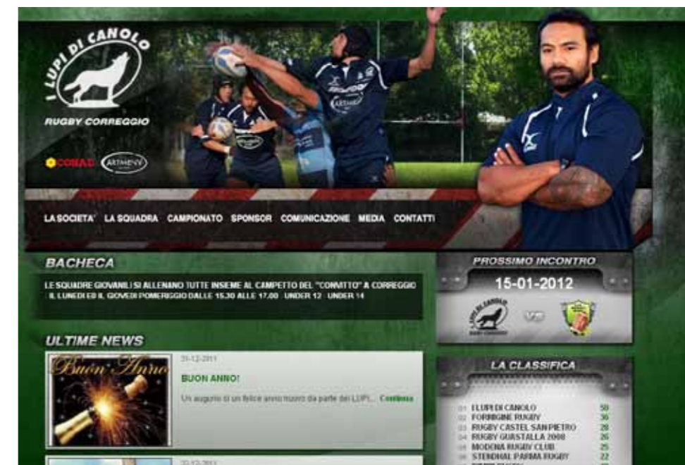
"La homepage del sito ufficiale dei Lupi di Canolo"